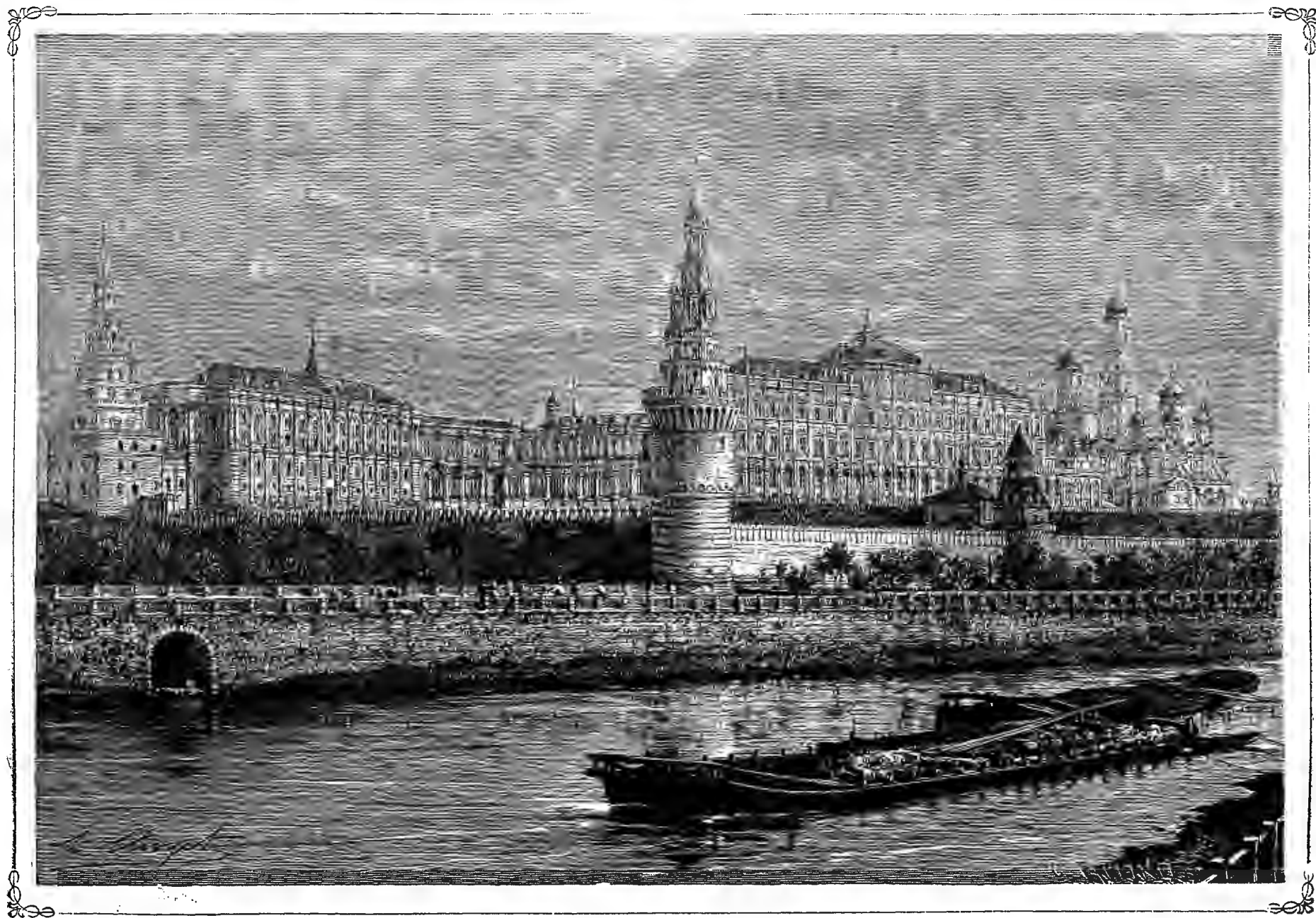
ВИДЪ МОСКОВСКАГО КРЕМЛЯ.