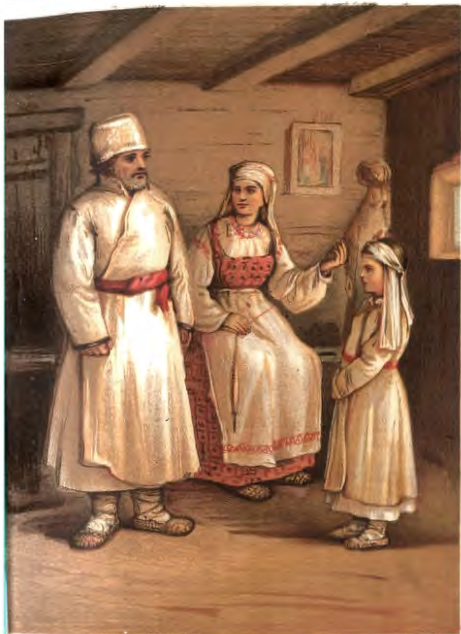
Б Ъ Л О Р У С С Ы .