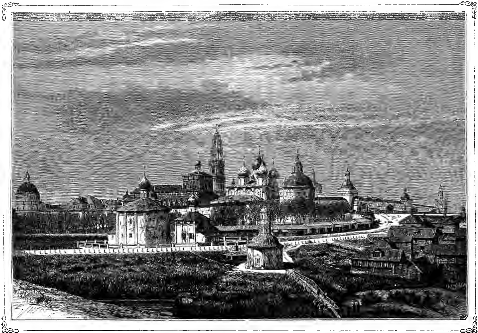
ТРОИЦКО-СЕРГИЕВСКАЯ ЛАВРА ВЛИЗЬ МОСКВЫ