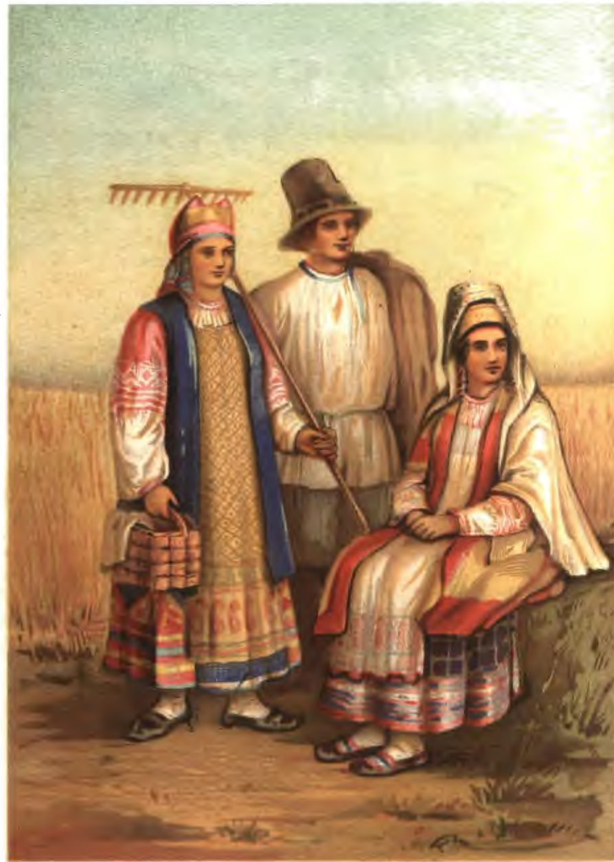
В Е Л И К О Р У С С Ы .