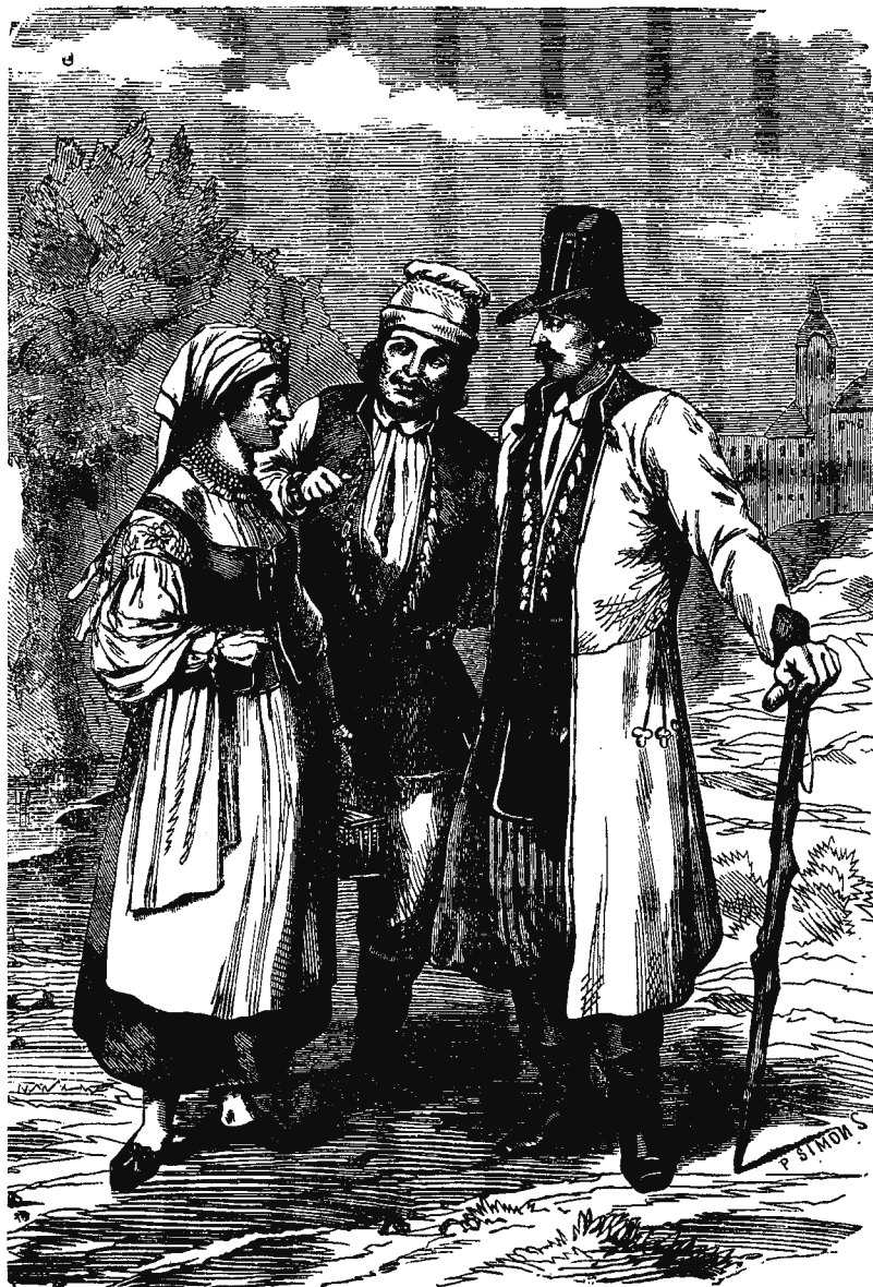
ПОЛЬСКІЕ КРЕСТЬЯНЕ ИЗЪ ПОДѢ КРАКОВА.

Въ ночь на 24-ое іюня, дѣвушки собираются на полѣ и разводять тамъ большой костеръ. Взав-