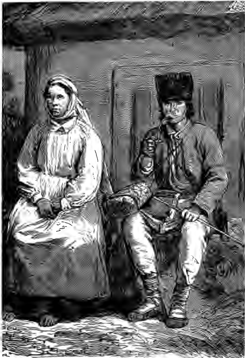
БЕЛОРУССЫ МИНСКОЙ ГУБЕРНИИ.