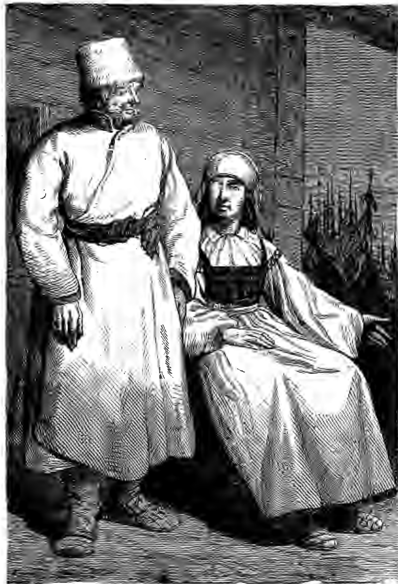
БЕЛОРУССЫ МОГИЛЕВСКОЙ ГУБЕРНИИ.