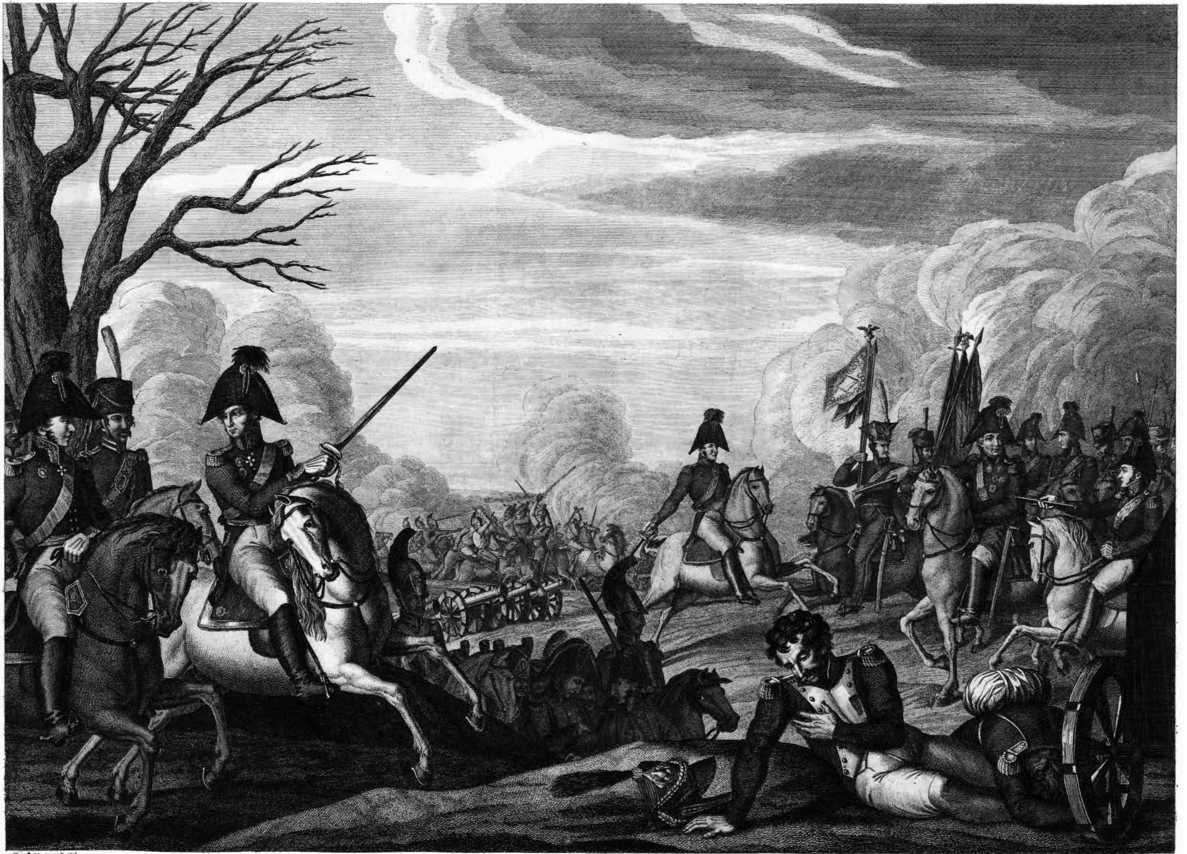
РАЗБИТИЕ МАРШАЛА ДАВУСТА при Г. КРАСНОМЪ 5 го ноября 1812.

Корпусная армия состоящая из бригады Давута, бригады Атаманова и из части корпусной бригады по команде самого Кутузова, разбита сиею армиею. Генералы Тормасов и Милорадович, Генерал-лейтенанты Фельд Тормасов, Генерал-майоры Бородин и Барон Вукоич полагаясь на свою допотопическую тактику, Корпусом потеряли убитыми 4000 человек; пленены: 2. Генерала, 30 офицеров и 8170 лошадей и орудий; все профессоры в плену; Александровской мурлы, 10 тысяч и 30 дроздовских мушкетеров.