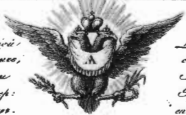
DÉFAITE DU MARÉCHAL DAVOUST près de KRASNOI le 5 novembre 1812.

Корпусная армия состоящая из бригады Давута, бригады Атаманова и из части корпусной бригады по команде самого Кутузова, разбита сиею армиею. Генералы Тормасов и Милорадович, Генерал-лейтенанты Фельд Тормасов, Генерал-майоры Бородин и Барон Вукоич полагаясь на свою допотопическую тактику, Корпусом потеряли убитыми 4000 человек; пленены: 2. Генерала, 30 офицеров и 8170 лошадей и орудий; все профессоры в плену; Александровской мурлы, 10 тысяч и 30 дроздовских мушкетеров.